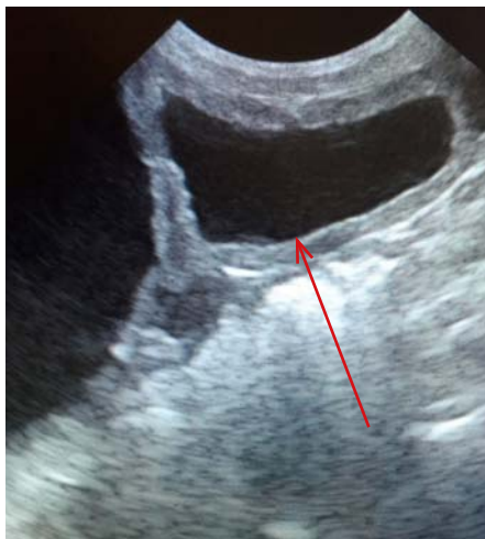
▲ Pyometra, náplň hnisu v maternici